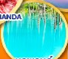
บรูพอนด์ (บ่อน้ำสีฟ้า)