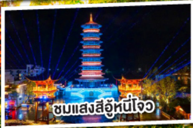
ชมแสงสีอุโมงค์