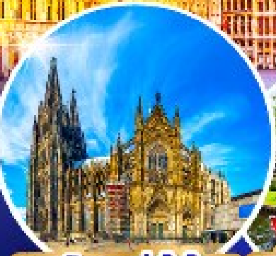
มหาวิหารแห่งโคโลญ หมู่บ้านกีร์ช