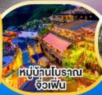
หมู่บ้านโบราณ จิวเฟิ่น