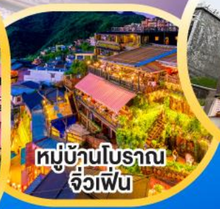
หมู่บ้านโบราณ จิวเฟิ่น