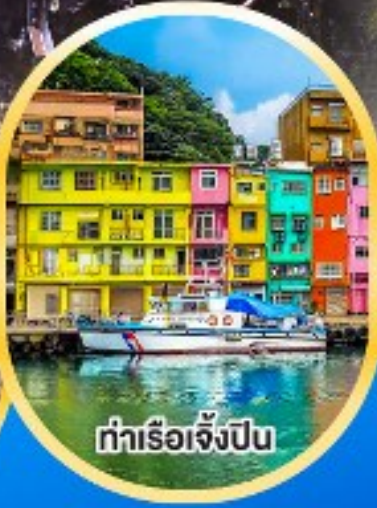
ท่าเรือจิ้งปิ่น