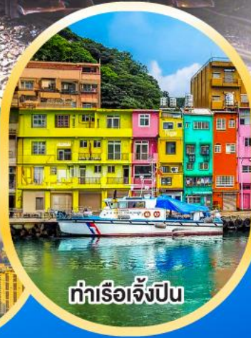
ท่าเรือเจิ้งปิน