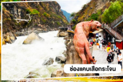
ช่องแคบลีเจียง