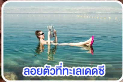
ลอยตัวที่ทะเลเดดซี