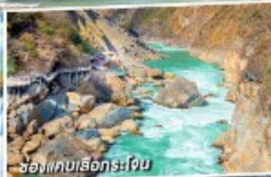
ช่องแคบเลือกระโจน