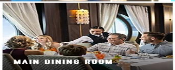
MAIN DINING ROOM