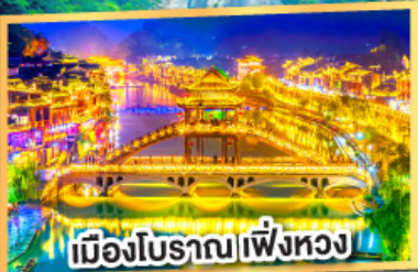
เมืองโบราณเพิ่งหวง