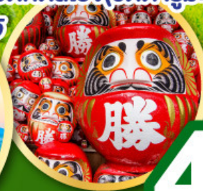
วัดคัตสึโฮจิ(วัดดาร์มะ)