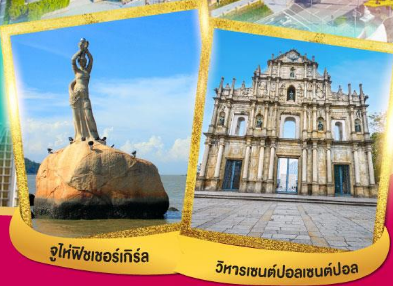
จูไห่พีชเชอร์เกิร์ล