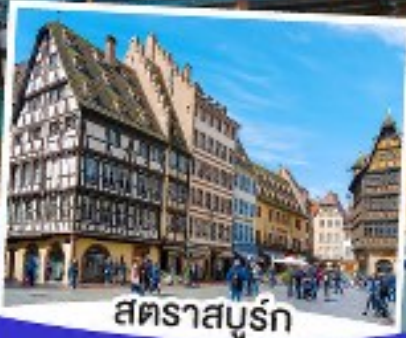
สตราสบูร์ก