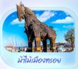
ม้าไม้เมืองทรอย