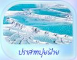
ปราสาทปุยฝ้าย