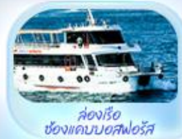
ล่องเรือ ช่องแคบบอสฟอรัส