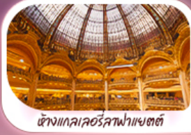
ห้างแกลเลอรีลูฟวร์