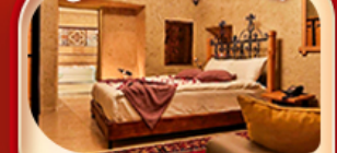
คัปปาโดเกีย