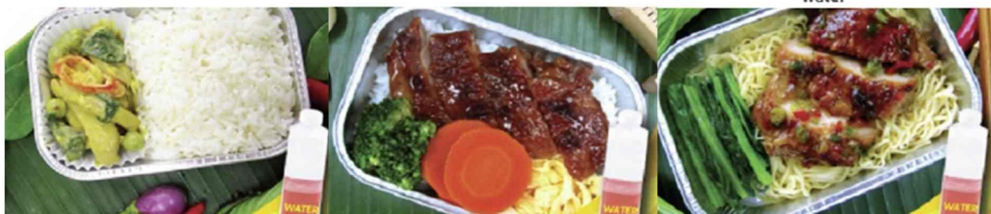
Chicken roasted with herb and noodle and water