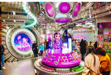
ร้าน POP MART