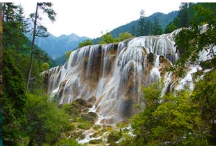
น้ำตกธารไข่มุก