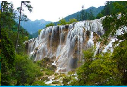
น้ำตกธารไข่มุก