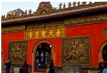
วัดต้าฉือ

พักที่ MAOXIAN INTER HOTEL โรงแรมระดับ 4 ดาวหรือเทียบเท่าในเมืองเม่าเซียน