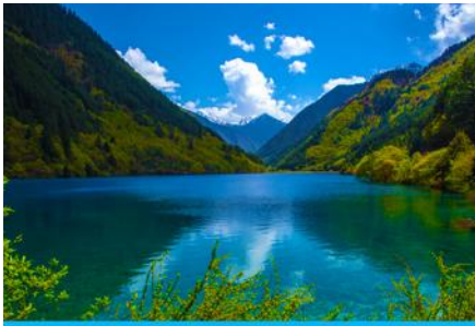
ทะเลสาบแรด (RHINO LAKE)