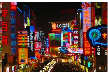
ถนนคนเดินซุนซื่อ