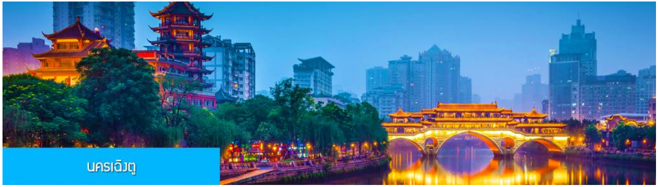
นครเฉิงตู