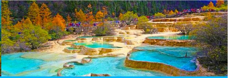
อุทยานหวงหลง