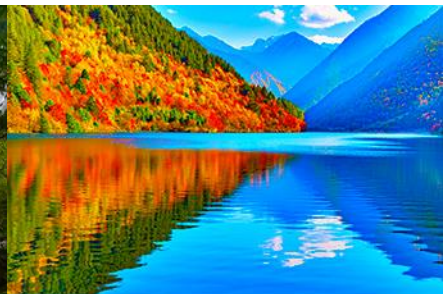
ทะเลสาบแพนด้า

วันที่สาม อุทยานจิวจ้ายโกว (รถเมลในอุทยาน)-ทะเลสาบแรด-น้ำตกธารไข่มุก-ทะเลสาบนกยูง-ทะเลสาบแพนด้า