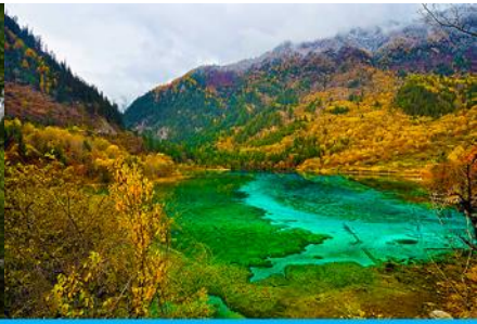
ทะเลสาบนกยูง (PEACOCK LAKE)

นำท่านชม ทะเลสาบแรด (RHINO LAKE) สูงจากระดับน้ำทะเล 2,301 เมตร น้ำลึกโดยเฉลี่ย 17 เมตร ยาวราว 2 กิโลเมตร เป็นทะเลสาบขนาดใหญ่ เสน่ห์อันน่าประทับใจของทะเลสาบนี้คือ หมู่มะเข้และสายหมอกที่สะท้อน ทะเลสาบแรดจนแยกไม่ออกว่าส่วนไหนที่เป็นท้องฟ้า ความเปลี่ยนแปลงของทั้งหมอกและหมอกในทิวเขา ให้ความงดงามที่แตกต่างกันไปในแต่ละวันอย่างน่าประทับใจ นอกจากนี้ทะเลสาบแรดเป็นทะเลสาบเดียวที่อนุญาตให้นักท่องเที่ยวล่องเรือยอซต์ได้