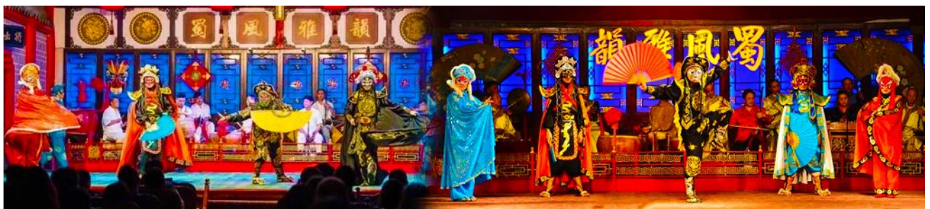
โชว์เปลี่ยนหน้ากาก

หลังอาหารนำท่านสามารถเลือกซื้อรายการทัวร์เสริม พิเศษการแสดง ชุด โชว์เปลี่ยนหน้ากาก 川剧变脸秀 เป็นศิลปะการแสดงพื้นบ้านที่ขึ้นชื่อที่สุดของจีน โดยผู้แสดงมีพรสวรรค์และทักษะพิเศษในการเปลี่ยนหน้ากากอย่างน่าทึ่ง จัดเป็นชุดการแสดงที่หาชมได้ยากและมีเฉพาะที่เมืองเฉิงตูเท่านั้น .....อัตราบัตรเข้าชม 300 หยวน หรือ 1,500 บาทต่อท่าน หรือสอบถามรายละเอียดเพิ่มเติมได้จาก ไกด์ท้องถิ่นหรือหัวหน้าทัวร์