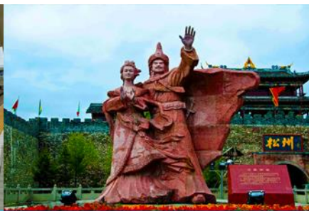
เมืองโบราณชงพาน