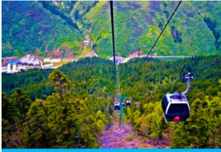
นั่งกระเช้าขึ้นสู่อุทยานหวงหลง