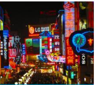
ถนนคนเดินชุนชิว