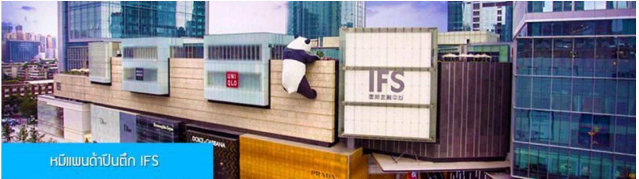
หมีแพนด้าปีนตึก IFS