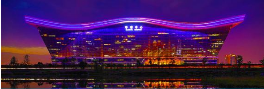
Chengdu new century global center