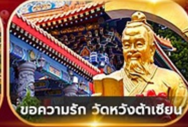
ขอความรัก วัดหวังต้าเซียน