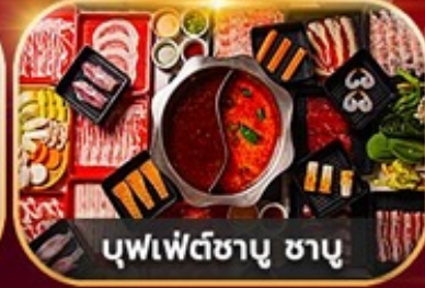
บุฟเฟ่ต์ซาบู ซาบู