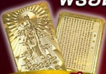
แถมพรี แผ่นทองเจ้าแม่กวนอิม