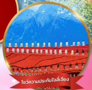
โชว์ความประทับใจลี่เจียง