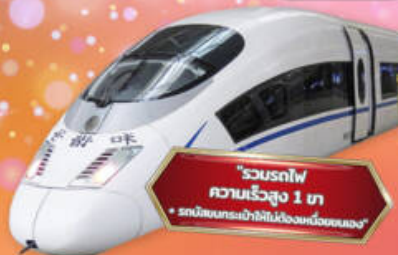
"รวมรถไฟความเร็วสูง 1 ท. + รถบริการนำขึ้น-ลงขบวนรถเอง"