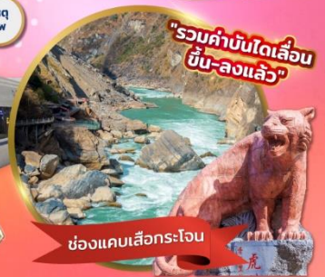
"รวมค่าบัตรรถไฟความเร็วสูง ขึ้น-ลงแล้ว"