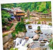
หมู่บ้านก๊ตก๊ต