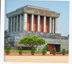
สุสานโฮจิมินห์