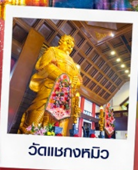
วัดเขกวงหมีว