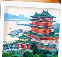
หอถึงหวังเก้อ