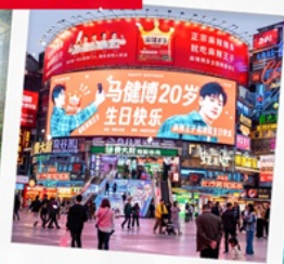
ถนนคนเดินหวงซิงสู๋