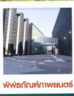
พิพิธภัณฑ์ภาพยนตร์