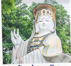
เจ้าแม่กวนอิม ธิวลีสเบย์