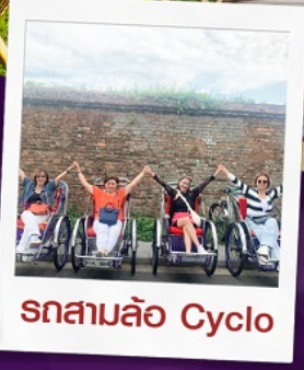
รถสามล้อ Cyclo