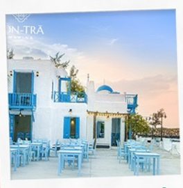
ซานตารีน่ากาแฟ