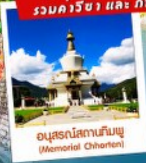
อนุสรณ์สถานทิมพู (Memorial Chorten)

2 คน พร้อมออกเดินทาง! รวมค่าวีซ่า และ ภาษีนักท่องเที่ยวแล้ว