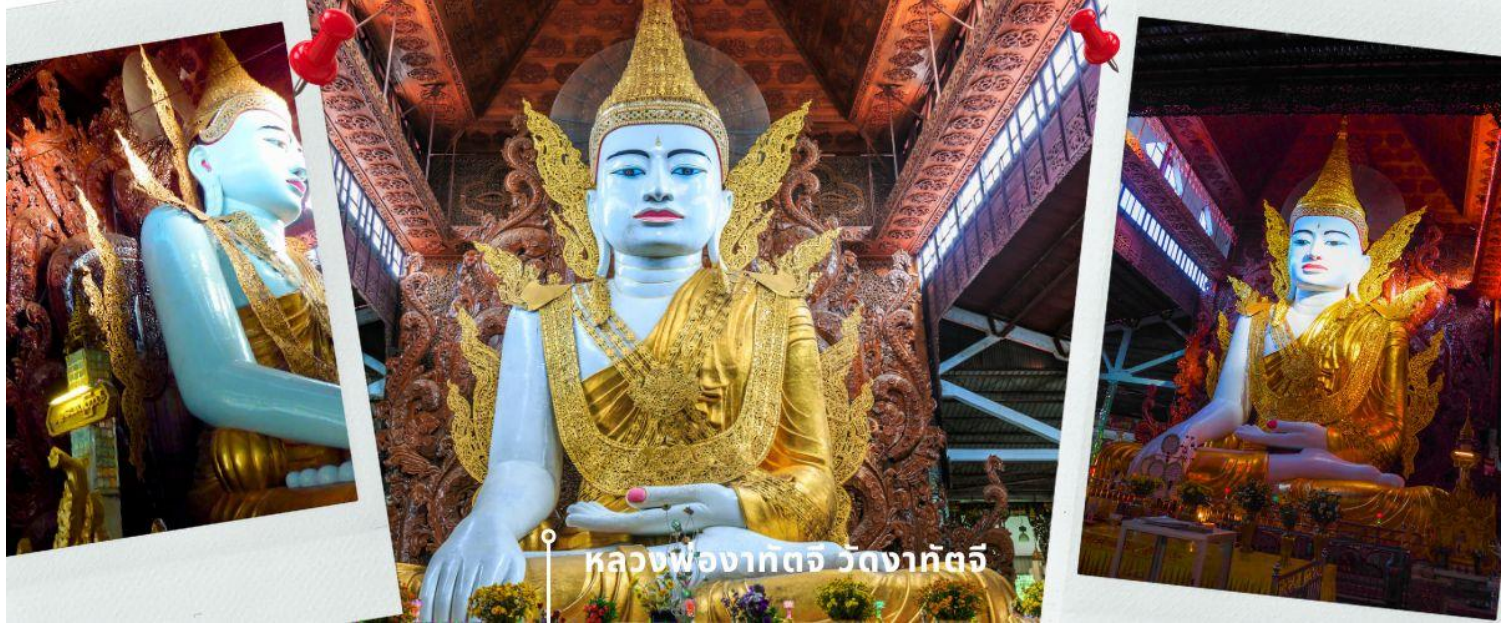
หลวงพ่อกัตจี วัดกัตจี

จากนั้นสักการะ หลวงพ่อกัตจี วัดกัตจี อย่างกึ่ง พม่า เป็นวัดที่ประดิษฐานพระพุทธรูปองค์ใหญ่ นั่นคือ หลวงพ่อกัตจี แปลว่า "หลวงพ่อกัตจีสูงเท่าตึก 5 ชั้น" เป็นพระพุทธรูปปางมารวิชัยที่แกะสลักจากหินอ่อน ทรงเครื่องแบบกษัตริย์ ส่วนด้านหลังเป็นไม้สักแกะสลักลวดลายต่างๆ จำลองแบบมาจากพระพุทธรูปทรงเครื่องสมัยยะตะนะโบง (สมัยมณฑลพายัพ) ส่วนประตูทางเข้าวัดกัตจีก็ประดับตกแต่งอย่างหรูหราด้วยหลังคาสีทองทรงปราสาทแบบพม่า 5 ชั้น และมีรูปปั้นสองสิงห์แบบศิลปะพม่าหรือจีนเต (Chinthe) เป็นทวารบาลอยู่ด้านหน้า วัดกัตจี ตั้งอยู่ที่ Ashay Tawya Monastery เมืองย่างกุ้ง ตรงข้ามวัดเจ้ากัตจี (Chauk Htat Gyi pagoda) หรือที่รู้จักกันในชื่อ “วัดพระตาหวาน” นั่นเอง