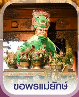
ขอพรแม่ยักษ์

✈️ คอนเฟิร์ม ออกเดินทาง ทุกพีเรียด 2 ท่านขึ้นไป