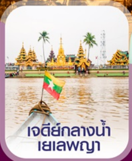
เจดีย์กลางน้ำ เยเลพญา

เช็กอิน อย่างกุง สีเรียม พระมหาเจดีย์ชเวดากอง ไหว้พระ 5 วัด เสริมบุญ ต้อนรับศักราชใหม่