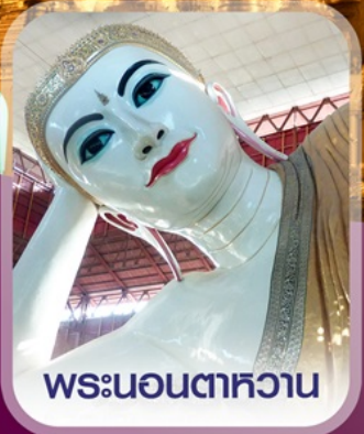
พระนอนตาทหวาน