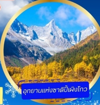
อุทยานแห่งชาติหนีเป่ิงโกว