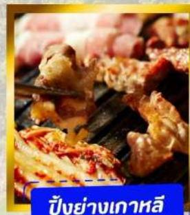
ปิ้งย่างเกาหลี