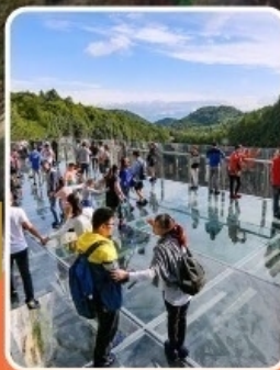
ระเบียงแก้วอุ๋หลง

ภูเขาหว่าอูซาน (รวมขึ้นกระเช้าไป-กลับ)- อุทยานเจานางฟ้า อุทยานหลุมฟ้าสะพานสวรรค์ - ระเบียงแก้วอุ๋หลง - รถไฟฟ้าทะเลตึก หงหยาดัง - วัดเป้ากัว - หลวงพ่อโตเลอซาน - วัดต้าฉือ หมี่เพนด้ายักษ์ ซุปปิ้ง ถนนคนเดินซุนซู่ ไท่กุหลี่