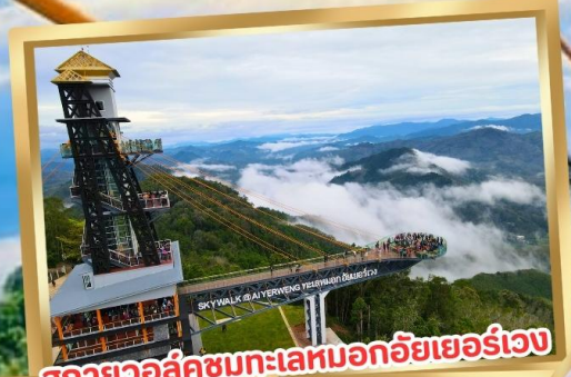
สกายวอล์คชมทะเลหมอกอัยเยอร์เวง

ร่วมโครงการ ลดหย่อนภาษี ลดสูงสุด 15,000.-