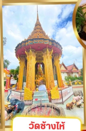
วัดช้างไห้