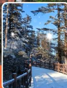
ภูเขาหว่าอูซาน