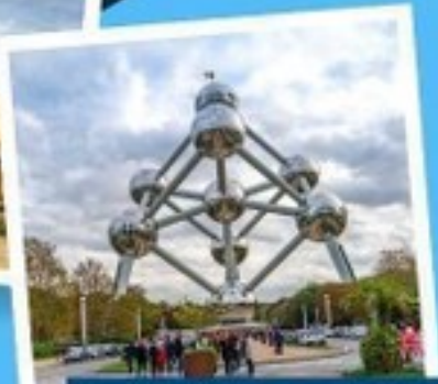
อะโตเมียม

สวิตเซอร์แลนด์ ฝรั่งเศส เบลเยียม เนเธอร์แลนด์ 8 วัน