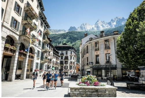
อิสระให้ท่านชมเมืองหรือช้อปปิ้ง

นำท่านชมเมืองซาโมนิกซ์ ที่ล้อมรอบด้วยขุนเขาสูง อิสระให้ท่านเพลิดเพลินเดินเล่น ชมเมือง ซาโมนิกซ์ ที่เป็นเมืองตากอากาศที่สวยงาม และมีการตกแต่งบ้านเรือนไว้อย่างสวยงาม ให้ท่านเดินเล่นช้อปปิ้งสินค้าพื้นเมืองของฝากของที่ระลึกมากมายกับบรรยากาศอบอุ่นไปด้วยภูเขาสูง หากอากาศดี ๆ ท่านสามารถมองเห็น ยอดเขามองบลั่ง ที่สูงถึง 4,807 เมตร สูงสุดในยุโรป และ อันดับที่ 11 ของโลก