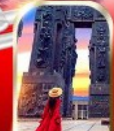
THE CHRONICLE OF GEORGIA