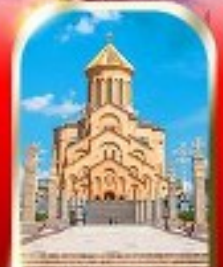
HOLY TRINITY CATHEDRAL