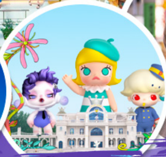
ช้อปบิง POP MART