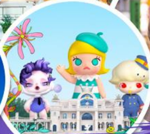
ซื้อบ๊ิง POP MART