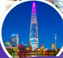
ดึกส์จอตเต็มจลค์