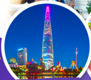
ตึกจ็อดเต้มจ็ลล์