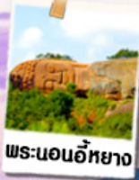
พระนอนอภัย