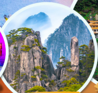
ภูเขาหวงชาน