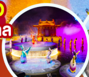
ชมโชว์อุทนีโจว