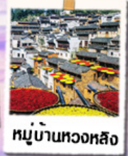
หมู่บ้านทงหลิง