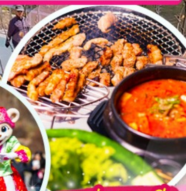
เมนูย่างเกาหลี