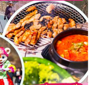
เมนูย่างเกาหลี