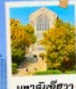
มหาสิริชีวา