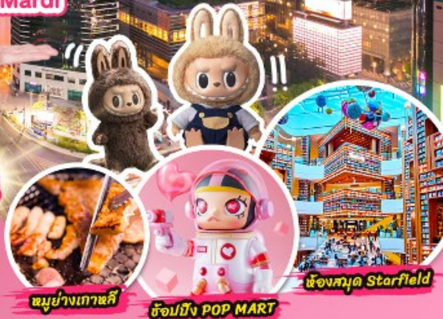
หมูย่างเกาหลี