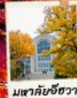
มเขาคันช็องวา

ไฮไลท์!! ชมไม้ไม้สีเหลืองสี "โซลฟอเรสต์"