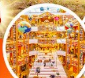
ห้องสมุดสตาร์ฟิชต์

• พิเศษ!! ใส่ชุดฮันบกเดินวัง + ถนนสายโรแมนติคที่อกซุกง