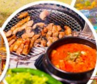
ตัวอย่างเกาหลี