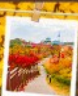
นัมซานพาร์ค