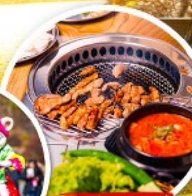
เมนูย่างเกาหลี