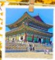
วังเคียงบกทง