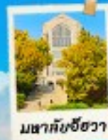
พิพิธภัณฑ์ช็องวา