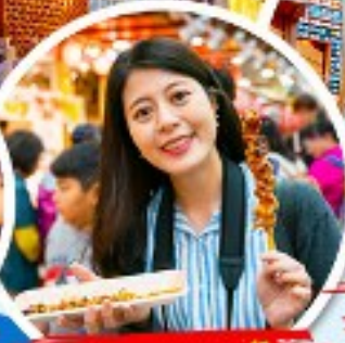
ตลาดควางจ้ง