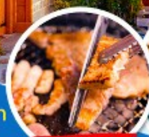
หมู่บ้านเกาหลี