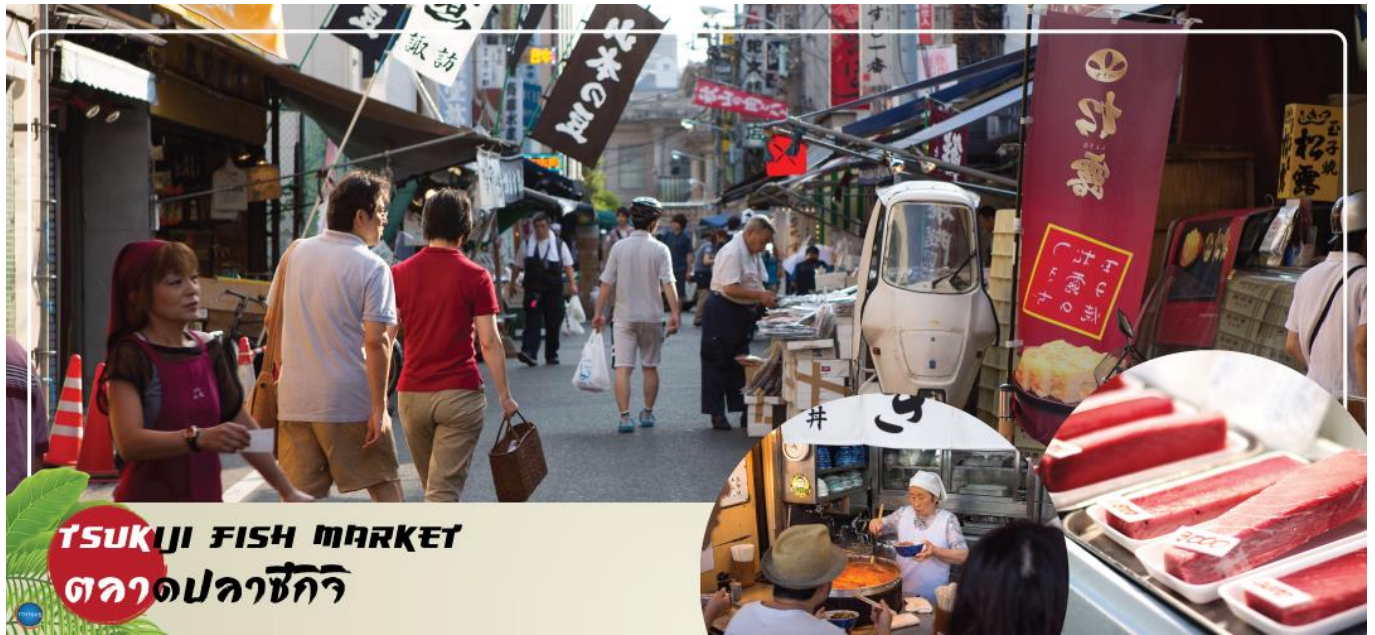
TSUKUJI FISH MARKET ตลาดปลาซึกิจิ

นำท่านสู่ (ใช้เวลาเดินทางประมาณ 20 นาที) ตลาดสดเก่าแก่แห่งหนึ่งของจังหวัดโตเกียว มีของอร่อยมากมายหลากหลายให้ท่านได้เลือกซื้อแะชิมความอร่อยกันอย่างจุใจ ภายในตลาดปลามีร้านทั้งร้านซูชิ แลปลาสดๆ ทั้งปลาทูน่า ปลาแซลมอน เป็นต้น ความอร่อยที่ไม่ควรพลาดอีกมากมายเช่น ไชหวานย่างชื่อดัง ข้าวหน้าปลาไหล ก๋วยเตี๋ยวเนื้อตุ๋นรสเด็ด ฯลฯ รวมถึงผลไม้ที่ท่านสามารถเลือกซื้อกลับบ้านได้อีกด้วย