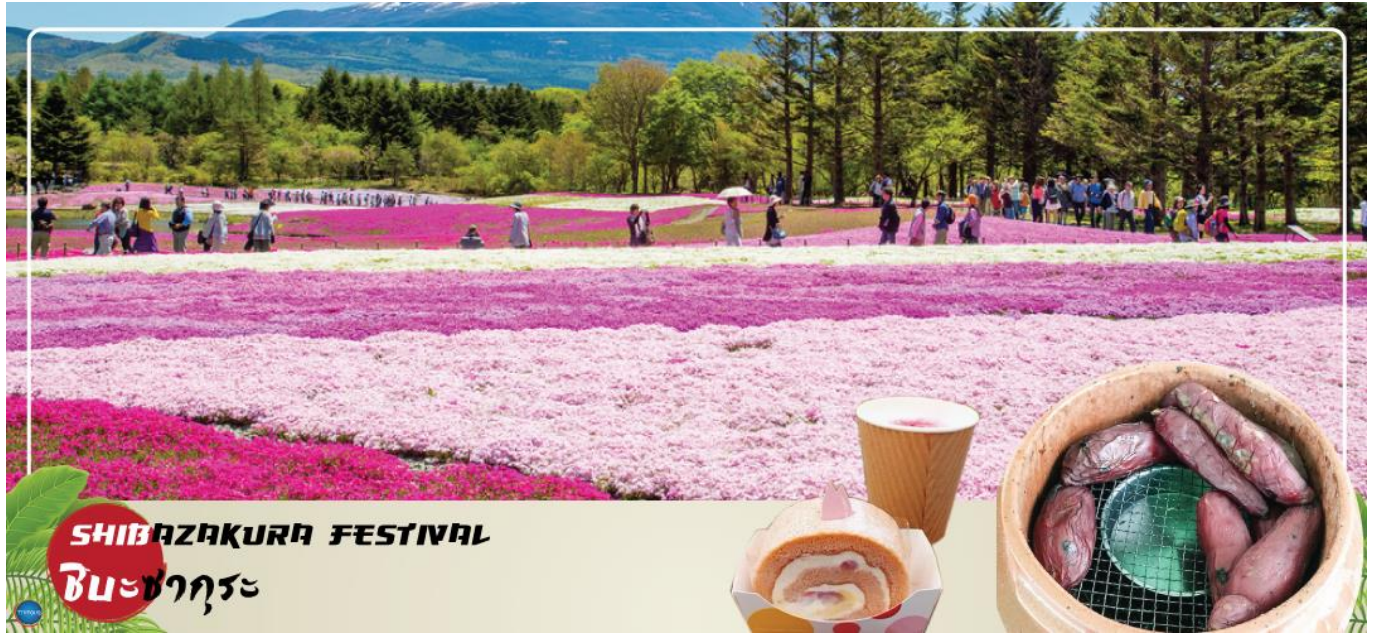
SHIBAZAKURA FESTIVAL ชิบะซากุระ

เช้า รับประทานอาหารเช้า ณ ห้องอาหารของโรงแรม (3) นำท่านเที่ยวชมเทศกาลดอกไม้ "ชิบะซากุระ" (Shibazakura Festival) (ใช้เวลาเดินทางประมาณ 50 นาที) หลังจากต้อนรับฤดูใบไม้ผลิด้วยดอกซากุระไปแล้ว ดอกไม้ที่จะมาอวดโฉมรับช่วงต่อไปนั่นก็คือ "ดอกชิบะซากุระ" หรือ "ดอกพืงค์มอส" ที่จะผลิบานในช่วง กลางเดือนเมษายนไปจนถึงเดือนพฤษภาคม เทศกาลชมดอกชิบะซากุระ ที่คาวาคุจิโกะ เมืองแห่งภูเขาไฟฟูจิ จังหวัดยามานาชิ เป็นเทศกาลหนึ่งที่มีชื่อเสียงมาก จุดเด่นของเทศกาล ชิบะซากุระ ที่คาวาคุจิโกะ ก็คือวิวภูเขาไฟฟูจินั่นเอง เราจะได้เห็นทั้งภูเขาไฟฟูจิ สัญลักษณ์ของญี่ปุ่น พร้อมๆ กับดอกชิบะซากุระสีชมพูสวยหวาน ถ่ายรูปมุมไหนก็สวย และนอกจากการชมดอกไม้แล้ว ในงานยังมีจุดขายอาหารและของหวานเมนูพิเศษที่ทำขึ้นในช่วงนี้โดยเฉพาะอีกด้วย (**หมายเหตุ เทศกาล Fuji Shibazakura Festival 2024 จะจัดขึ้นในช่วงวันที่ 13 เมษายน – 26 พฤษภาคม 2567) แหล่งอ้างอิง https://www.fujimotosuko-resort.jp/flower/shibazakura/index.html