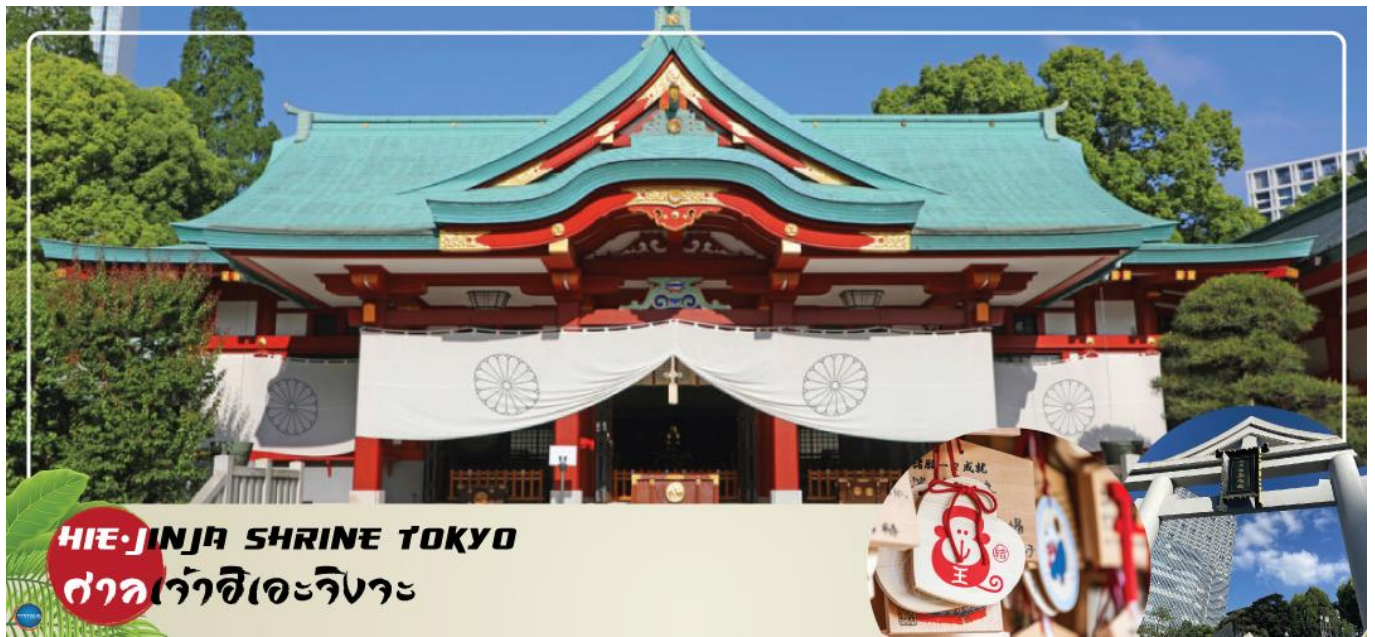
HIE-JINJA SHRINE TOKYO ศาลเจ้าฮิเอะจิงจะ

วันที่สี่ เมืองนาริตะ – กรุงโตเกียว – ศาลเจ้าฮิเอะจิงจะ – พระราชวังอิมพีเรียล (ด้านนอก) – สะพานแว่นดา – ตลาดปลาซึกิจิ – ย่านโอไดบะ – ห้างไดเวอร์ซิตี – เมืองนาริตะ – อีออนมอลล์ ภาครัฐ