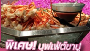
พิเศษ! นูฟเฟ็ตชิยาปู