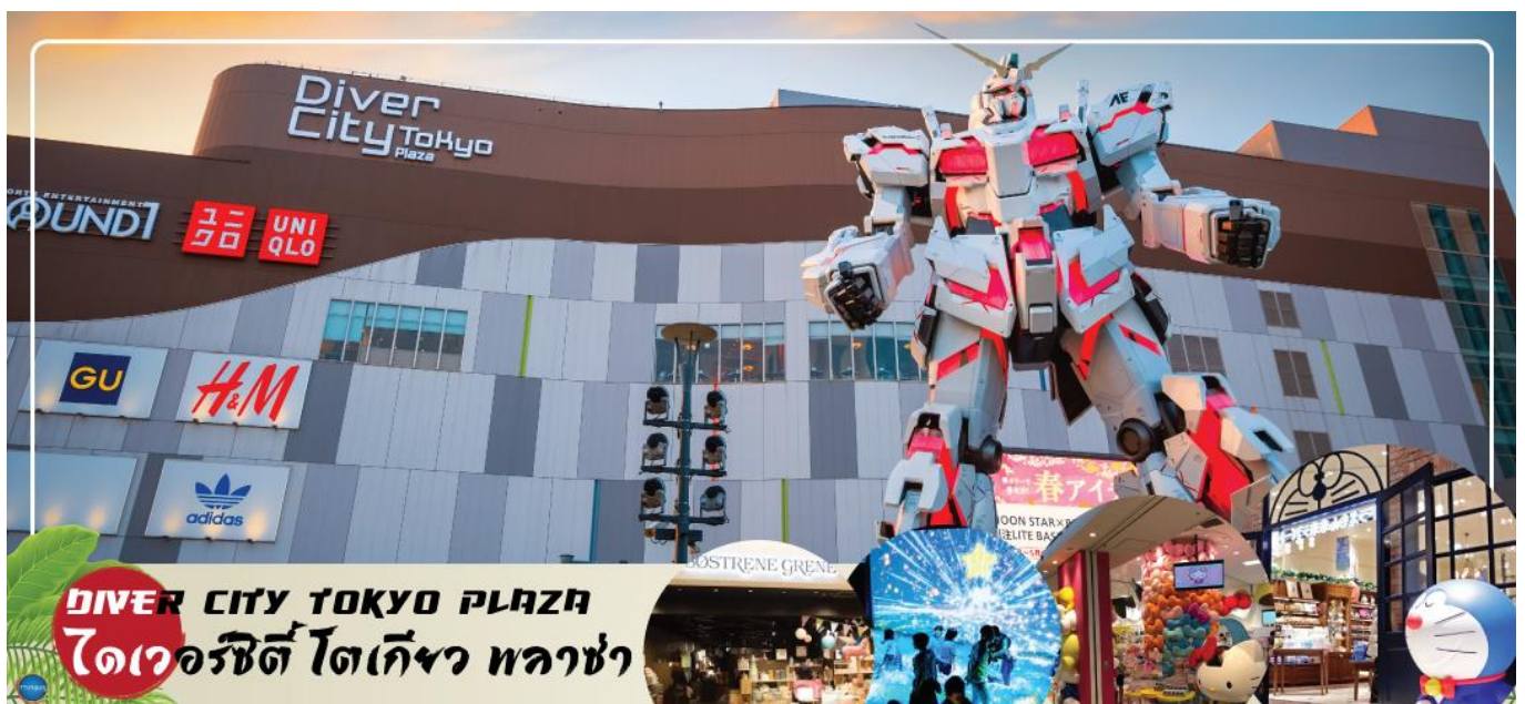
DIVER CITY TOKYO PLAZA ไดเวอร์ซิตี โตเกียว พลาซ่า

จากนั้นเดินทางสู่ อีออนมอลล์ มาคฮาริ ชินโทชิน (AEON MALL Makuhari Shintoshin) (ใช้เวลาเดินทางประมาณ 45 นาที) ห้างสรรพสินค้าที่นิยมในหมู่นักท่องเที่ยว ภายในตกแต่งในรูปแบบที่ทันสมัยสไตล์ญี่ปุ่น มีร้านค้าที่หลากหลายมากกว่า 150 ร้านจำหน่ายสินค้าแฟชั่น อาหารสดใหม่ และอุปกรณ์ภายในบ้าน นอกจากนี้ยังมีร้านเสื้อผ้าแฟชั่นมากมาย เช่น MUJI, 100 yen shop, Sanrio store, Capcom games arcade และซูปเปอร์มาร์เก็ตขนาดใหญ่