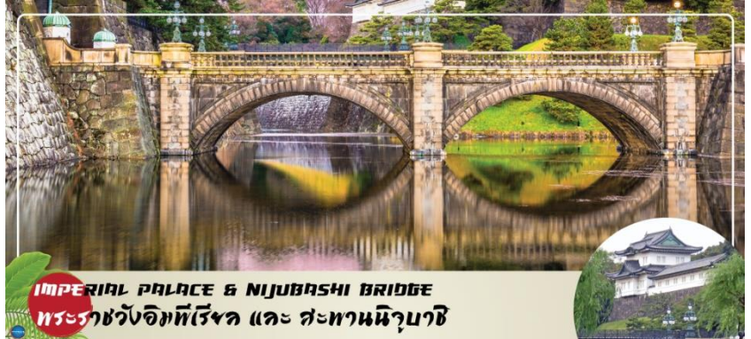
IMPERIAL PALACE & NIJUBASHI BRIDGE พระราชวังอิมพีเรียล และ สะพานนิจูบashi

เสน่ห์ของสะพานข้ามคูน้ำ สู่ พระ รา ช วัง แห่ง กรุงโตเกียว ที่มีชื่อเรียกว่า แว่นดาก็เพราะส่วนโค้งที่อยู่ติดกันด้านล่างสะพาน นั้นมีรูปร่างเหมือนแว่นดา เมื่อสะท้อนกับผิวน้ำ ส่วน ทางด้านหน้าพระราชวัง เป็นอุทยานแห่งชาติโคเคียวไกเอ็น (Kokyo Gaien National Garden) เป็นสวนสาธารณะขนาดใหญ่