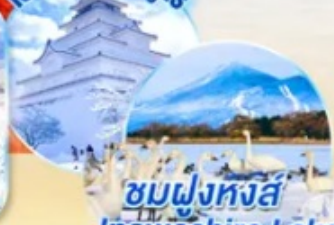
ชมฝูงหงส์ Inawashiro Lake