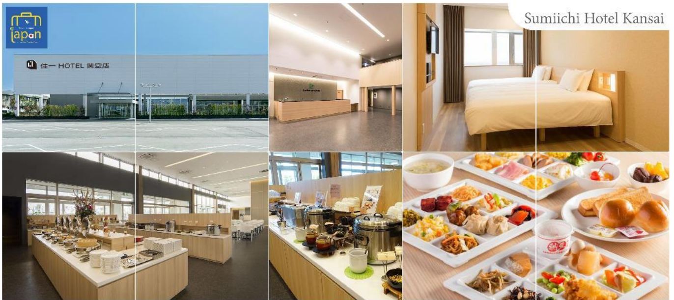
Sumiichi Hotel Kansai

พักที่ SUMIICHI HOTEL KANSAI หรือเทียบเท่าระดับเดียวกัน (โดยรถบัสโรงแรม)