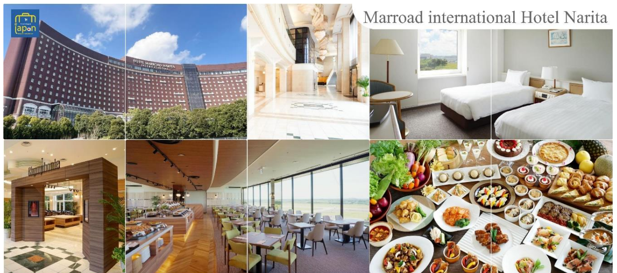
Marroad international Hotel Narita

MARROAD INTERNATIONAL HOTEL NARITA หรือเทียบเท่าระดับเดียวกัน