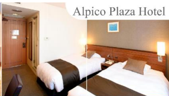
Alpico Plaza Hotel