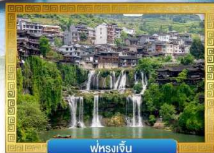
ฟูหลงเจิ้น